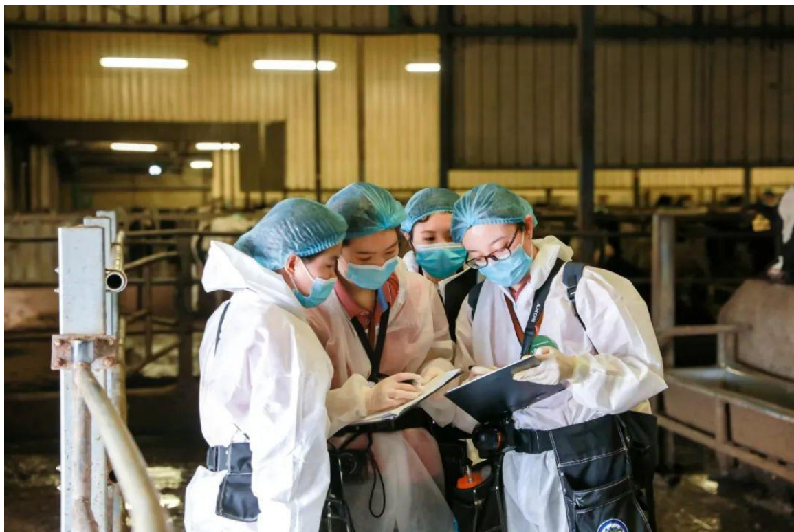
第四届牛精英挑战赛奶牛组特等奖牧场评估

农业是国民经济的基础和战略产业，高层次农业科技人才培养是农业及涉农高校的使命和责任。2021年2月21日中共中央国务院发布《关于全面推进乡村振兴加快农业农村现代化的意见》，文件指出，要把解决好“三农”问题作为全党工作重中之重，把全面推进乡村振兴作为实现中华民族伟大复兴的一项重大任务。中国研究生乡村振兴科技强农+创新实践大赛是农科研究生创新实践改革的重大举措，是教育助力国家乡村振兴战略的重要体现。大赛顺应研究生教育改革和发展趋势，在教育部的指导和行业部委的支持下，联结各界力量，以赛促学、以赛促研、以赛促创，构建政产学研用融通的创新实践平台，激发青年学子进行农牧领域技术创新和应用创意的热情，完善竞赛育人的人才培养体系。