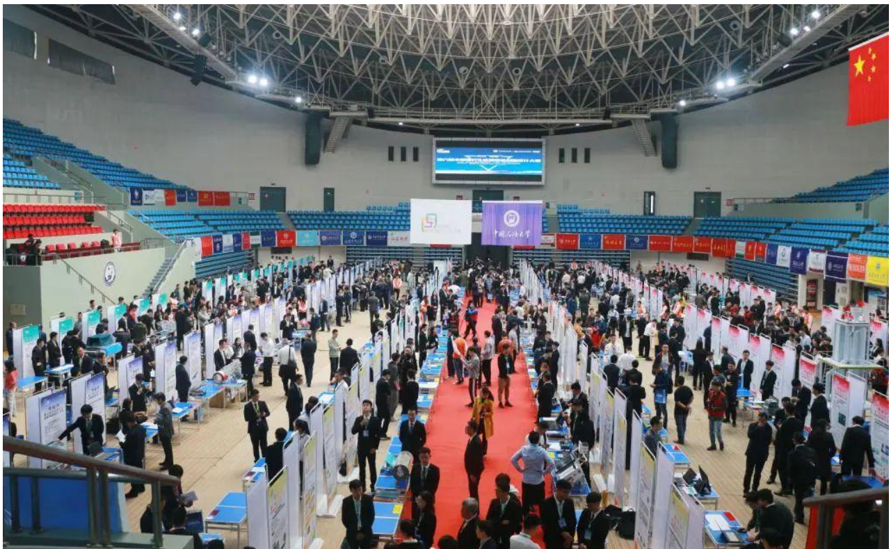
第六届中国研究生能源装备创新设计大赛总决赛现场

中国研究生能源装备创新设计大赛源于2014年中国石油大学（华东）发起创办的中国研究生石油装备创新设计大赛，2016年（第三届）起被纳入“中国研究生创新实践系列大赛”，2019年升级为“中国研究生能源装备创新设计大赛”，为保持赛事历史的延续，届次接续为第六届。大赛旨在进一步激发研究生创新热情，培养研究生创新思维，提升研究生创新实践能力，促进国家能源装备业创新发展。